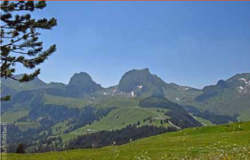
GOTTESDIENSTE IM AUGUST